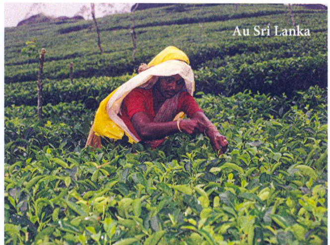
Au Sri Lanka